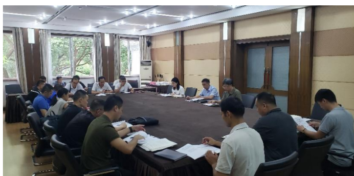
(学校召开专项遴选工作会)

本次专项遴选工作分为摸底调查、集中宣讲、专项报名、专项考核等环节。遴选采用学生自愿报名，学校集中考核、择优录取的原则。为确保各环节工作顺利开展推进，教务处、后勤处、相关院（系）、教研室及学管办做了大量的前期准备工作。一是教务处专门制定了《体育教育专业 2021 级学生专修项目遴选方案》，确定整体遴选工作安排及操作流程；二是组织各相关院系负责人召开专项遴选工作会，研究部署贯彻落实工作；三是由各教研室专门设计考核的整体框架，制定具体评分标准；四是教务处、后勤处及各院（系）沟通协调，确保各环节安排有序，场馆设施齐全，人员不缺位；五是在新生报到的第一时间，进行专项遴选摸底调查，提前为后期报名考核做足充分准备。