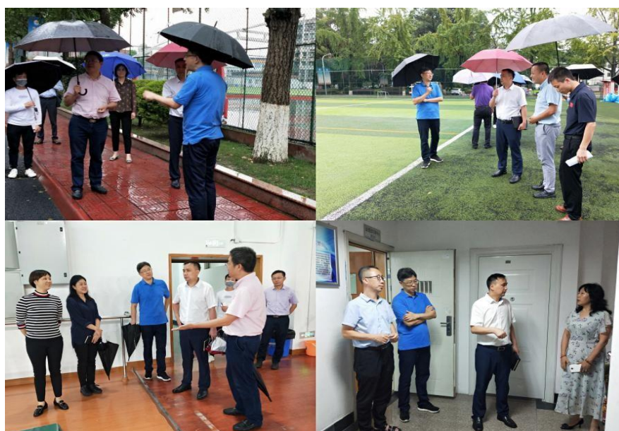
(检查组实地走访教学场地)

检查组一行依次实地走访足球场、篮球场、体操馆、健康大厦等教学区域，重点对各教学场馆（地）、各类实验室、公共机房的安全、环境卫生及各类教学设施的运行情况进行详细检查。从检查情况来看，我校各项开学准备工作情况整体较好，但在一些细节方面有待强化。针对发现的问题和不足，检查组现场督促各相关部门及时协调解决。