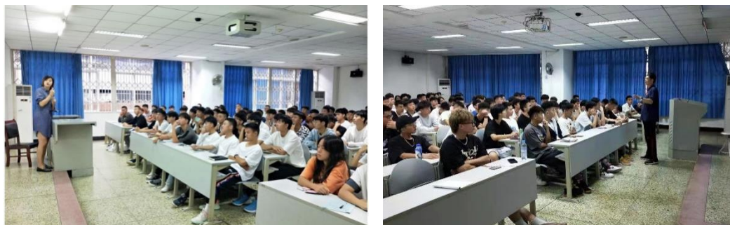
(学校组织专项遴选宣讲会)