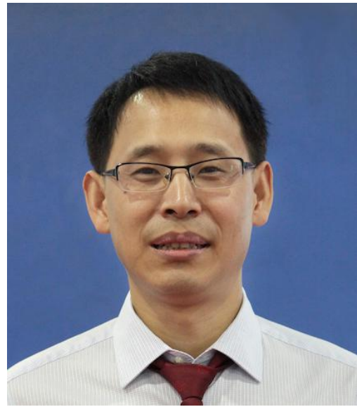
杨成波 教授 硕士研究生导师 乒乓球国际级裁判