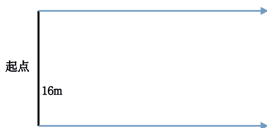
图 2-1 定位踢远示场地设置图

考试办法：如图2-1所示，每人三次机会，在16米的范围内踢远，男子踢远50米为30分，每减少1米扣1分；女子踢远40米为30分，每减少1米扣1分。